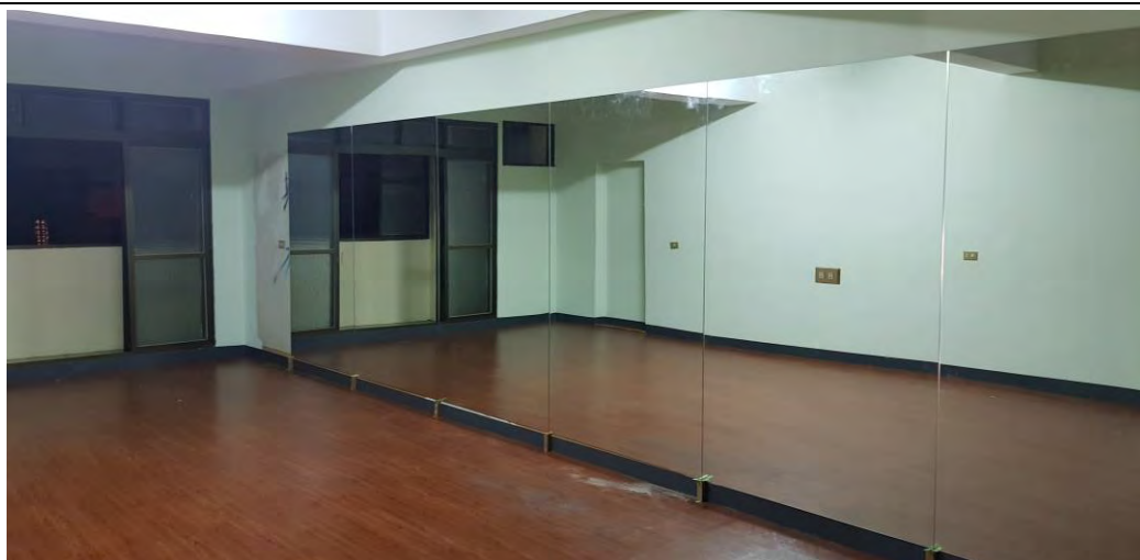
四樓裝修後為舞蹈教室，提供據點及身障朋友可做肢體活動舒適空間