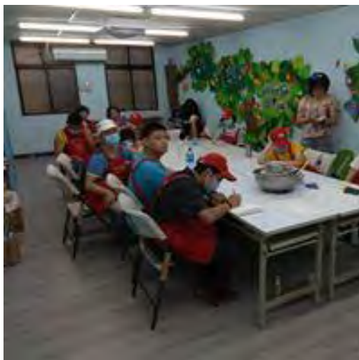
新會址二樓修整後成為多元化教室，圖為餅干製做教學課程。