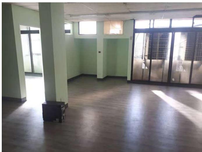
二樓裝修後 行政辦公空間